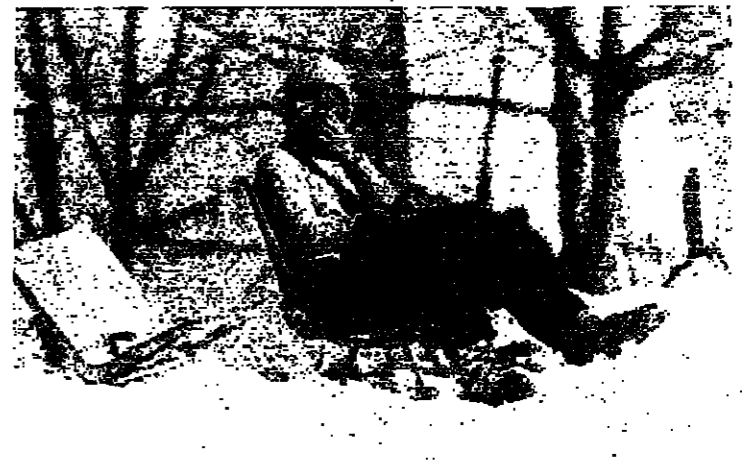
جلسة تحت الشمس وسوق الثلج